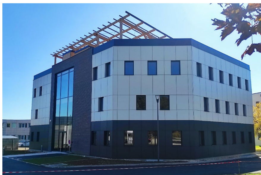
Photo des locaux « YMAGEO » en date du 05/10/2022